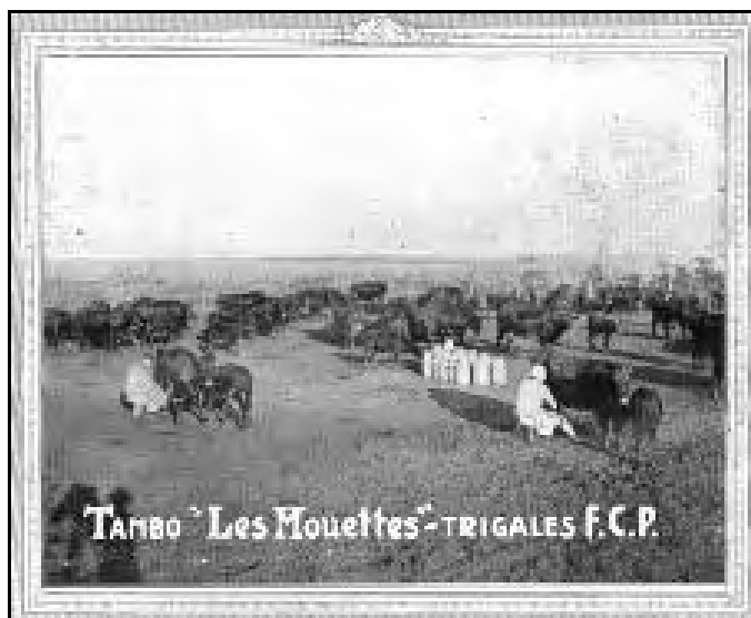
Antiguo tambo Shorthorn lechero. Diciembre de 1926. Revista "El Shorthorn (Durham) Lechero Argentino", 2(20):1065

Shorthorn doble propósito: poca difundida en Argentina.