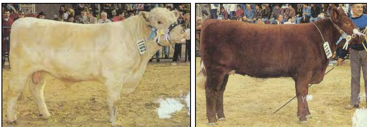
Toro Shorthorn blanco y vaquillona Shorthorn colorada. Exposición Palermo 1999.

ASOCIACIÓN: Asociación Argentina de Criadores de Shorthorn, Tucumán 994, P.5°, (1049) Buenos Aires, Tel/fax 011-4326-2212/2225. E-mail: shorthorn@dd.com.ar