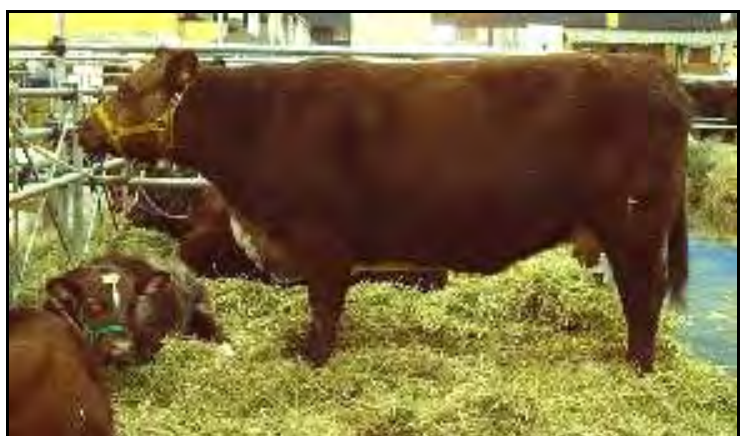
a) Vaca Shorthorn rosilla con su cría colorada en Palermo y b) vaca Shorthorn en Exposición de Palermo 2005.

CARACTERÍSTICAS: el pelaje es colorado, blanco, rosillo colorado o rosillo blanco. No se acepta la presencia de pelos negros y pelaje abayado. Cuernos finos y cortos, de color blanco con puntas castañas. Mucosas rosadas. Es una raza muy fijada, que imprime en cruza sus características. De las razas británicas es la de mayor producción de leche y la de menor rusticidad, lo que se comprende por su zona de origen y selección. Para mostrar su máximo potencial genético necesita buenos pastoreos y clima templado.