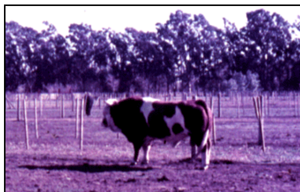
a)-Vaquillona Reservada Gran Campeona Exposición Rural de Palermo; b)- Toro Fleckvieh en Centro de Inseminación Artificial Venado Tuerto (CIAVT) 1981.

CARACTERÍSTICAS: El pelaje es overo, pudiendo variar de un colorado oscuro a un amarillo tostado, con manchas y marcas blancas de cualquier tipo. La cabeza y el bajo vientre generalmente son blancos. El penacho de la cola blanco. Se permiten las cuatro patas de color siempre que el bajo vientre y la cola sean blancos. El color predominante en la cabeza vista de frente es blanco. Es deseable la pigmentación alrededor de los ojos. Morro rosado, ámbar o marrón. Lunares negros en el morro están permitidos. Pezuñas generalmente blancas o amarillas, pero las pigmentadas están permitidas. Cuernos de desarrollo armónico. Se selecciona para rápidos aumentos de peso diario.