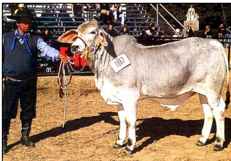
Toros en Exposición Rural de Palermo (Bs.As.)

CARACTERÍSTICAS: Posee un gran desarrollo muscular, especialmente en sus cuartos posteriores. Las orejas, como en la mayor parte de los cebú, son grandes y pendulosas, lo que lo diferencia a simple vista del Nelore. Los cuernos son similares a los del Nelore y el prepucio mas penduloso. El pelaje tiene tonalidades variables entre el blanco, gris y casi negro. La piel es igual a la del Nelore. Los terneros al nacer son mas pesados que los del Nelore (30 Kg las hembras y 35 los machos). Los pesos son semejantes a los del Nelore. Es muy