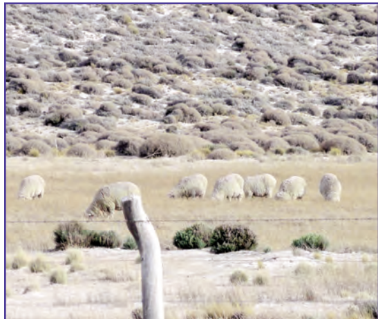
Ovejas pastoreando en mallín con cenizas.

Esta diferenciación permite resaltar las zonas y los grupos más vulnerables frente a la situación de emergencia actual.