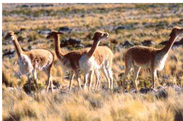
Foto 14: Vicuña (Perú). Produce una fibra de calidad muy alta. Es cruzada con la alpaca para mejorar la calidad de su fibra.

La vicuña habita los Altos Andes, entre 3000 y 4000 m de altura. La distribución actual se extiende entre 9°30"S y 29°00"S en Argentina, Bolivia, Chile y Perú. Perú alberga más de la mitad de la población total de vicuñas censadas en los países que protegen a esta especie. Sin embargo, su conservación en este país se ve confrontada en nuestros días con numerosas dificultades. La vicuña en Argentina se dice que está en estado de recuperación a pesar de los problemas de caza furtiva y la aplicación irregular de la ley. En Bolivia, la población es muy inestable por falta de una continuidad de la política de protección establecida hace algunos años. En Chile, la población de vicuñas muestra una neta recuperación y el peligro de desaparición que pesaba sobre ella recientemente ha sido alejado. La población actual, basada en censos realizados en 1990 (Argentina y Perú) y en 1989 (Bolivia y Chile) es la siguiente: