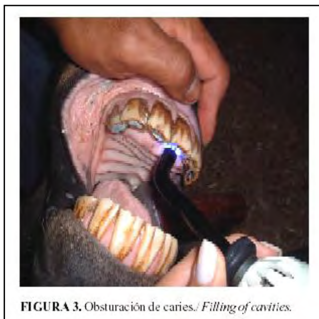
FIGURA 3. Obturación de caries./ Filling of cavities.

Las lesiones cariosas que se presentan en las superficies dentales del equino pueden ser obturadas con resinas de fotocurado (Figura 3), o también con amalgama dental. En términos generales se siguen los mismos protocolos utilizados para los seres humanos, con la diferencia notable en la cantidad de materiales empleados (38).