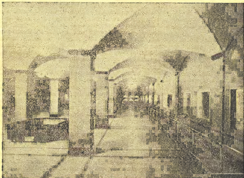
Sala del acuario del Departamento de Pesca, en Wáshington.